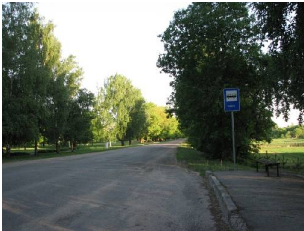
Bauskas rajona padome