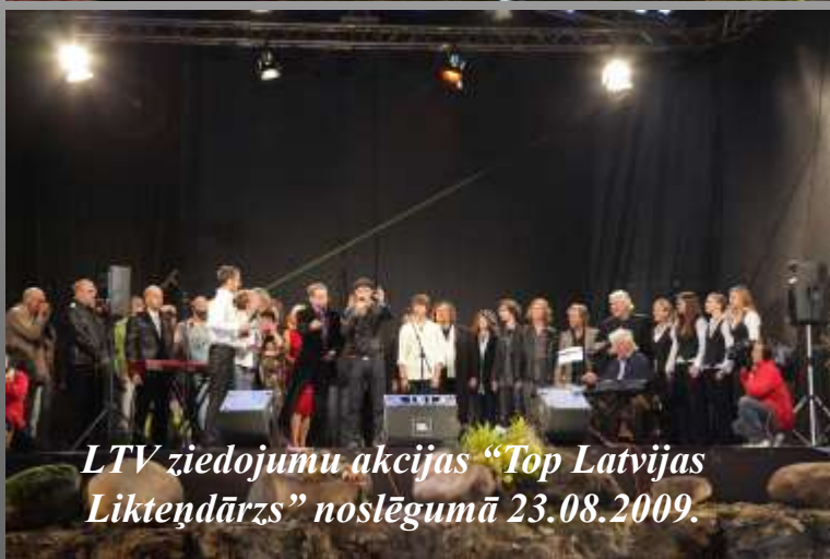
LTV ziedojumu akcijas "Top Latvijas Likteņdārzs" noslēgumā 23.08.2009.