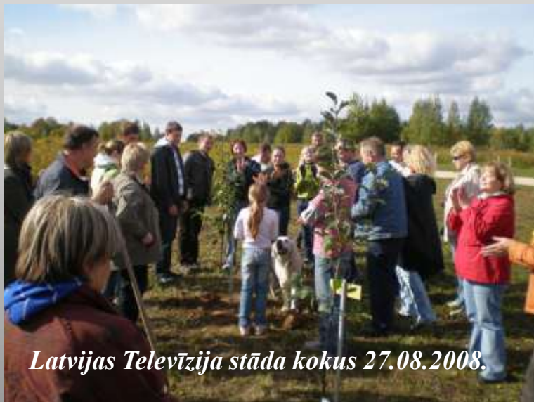
Latvijas Televīzija stāda kokus 27.08.2008.