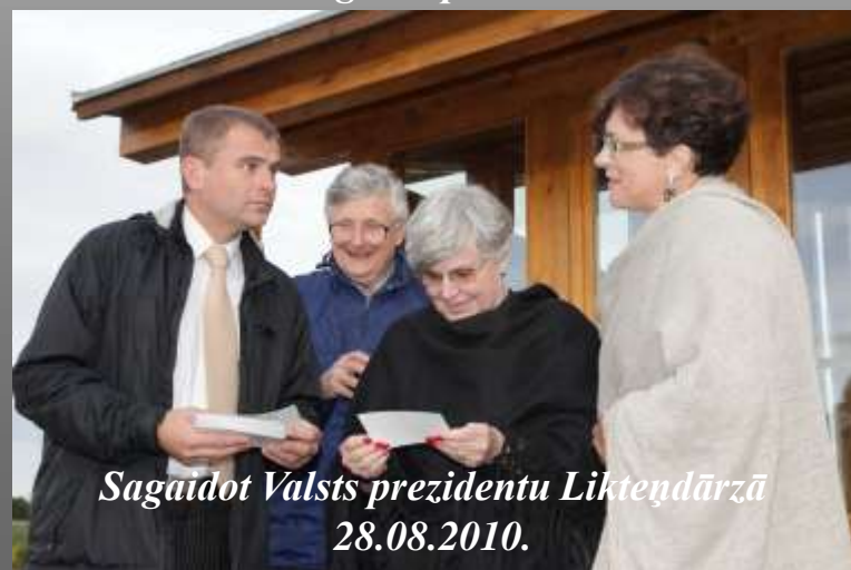
Sagaidot Valsts prezidentu Likteņdārzā 28.08.2010.