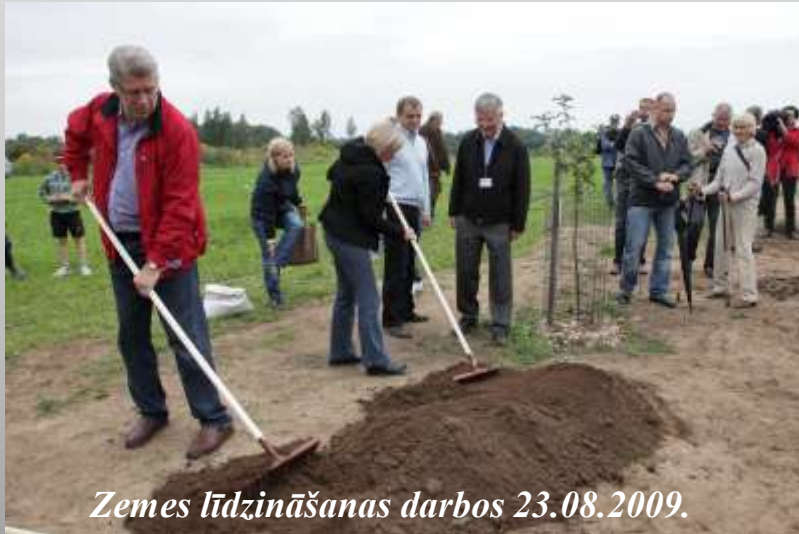
Zemes lūdzināšanas darbos 23.08.2009.