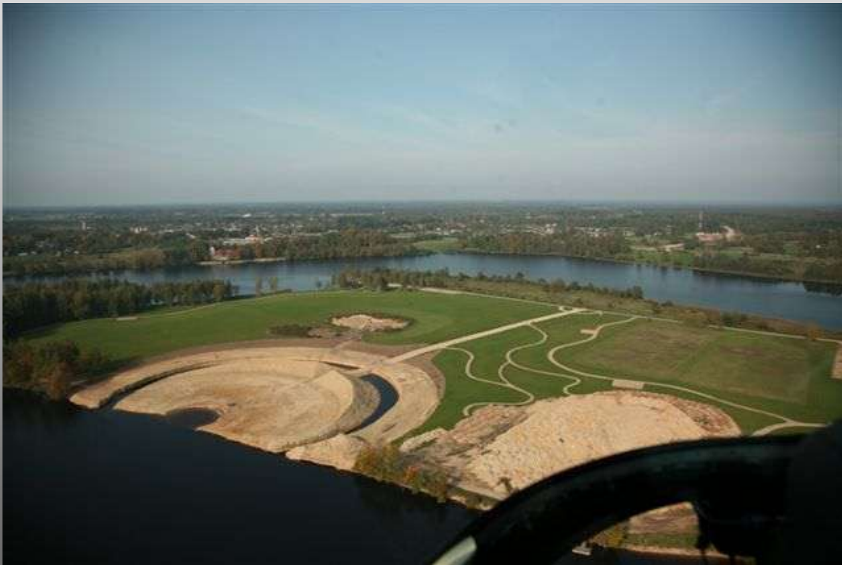
Likteņdārzs 2010. gada septembrī.