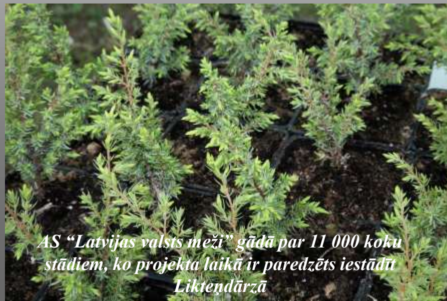
AS “Latvijas valsts meži” gādā par 11 000 koku stādiem, ko projekta laikā ir paredzēts iestādīt Likteņdārzā