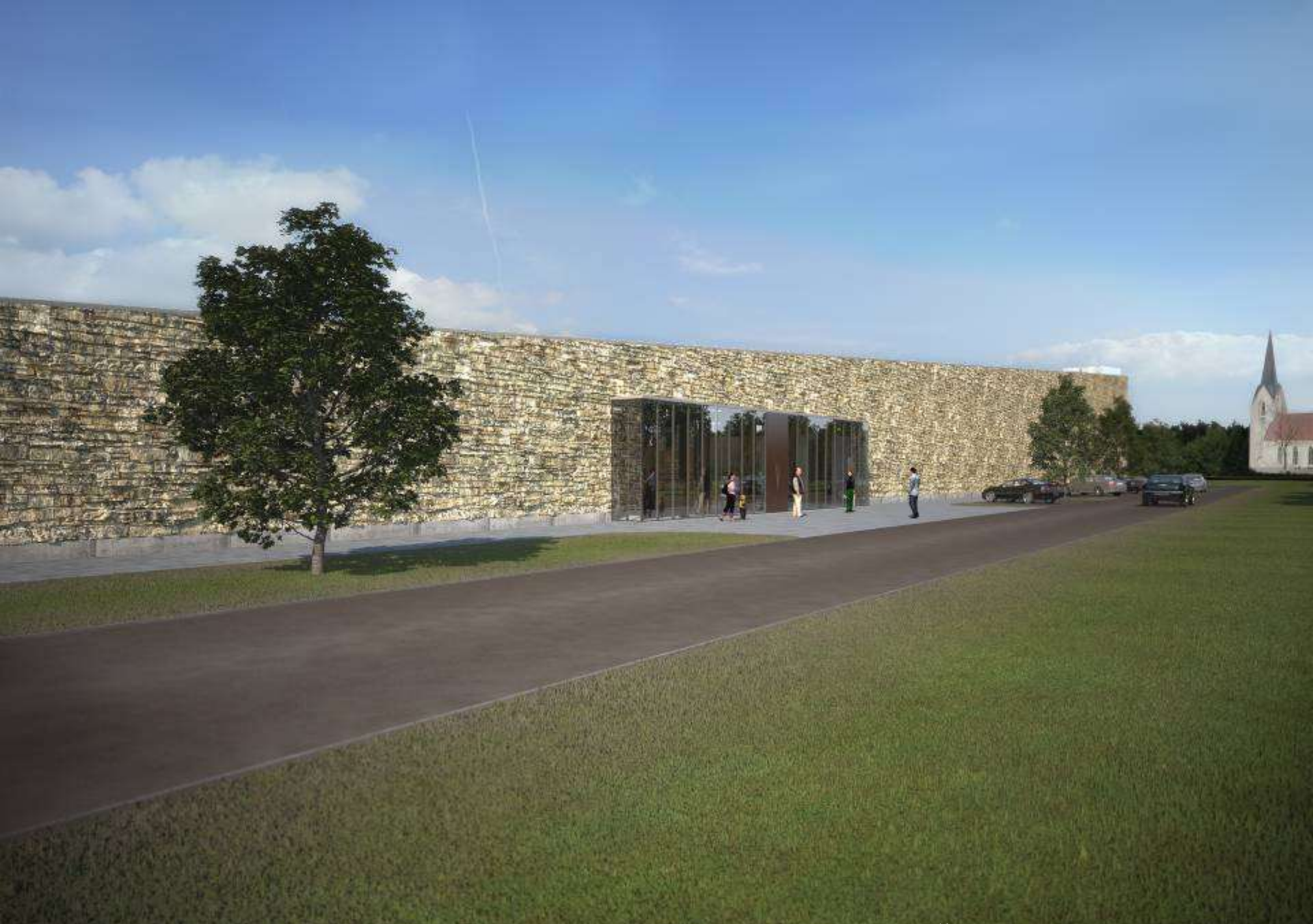
Likteņdārza daudzfunkcionālās sabiedriskās ēkas vizualizācija – SIA “Projektēšanas birojs ARHIS” 2009. gads