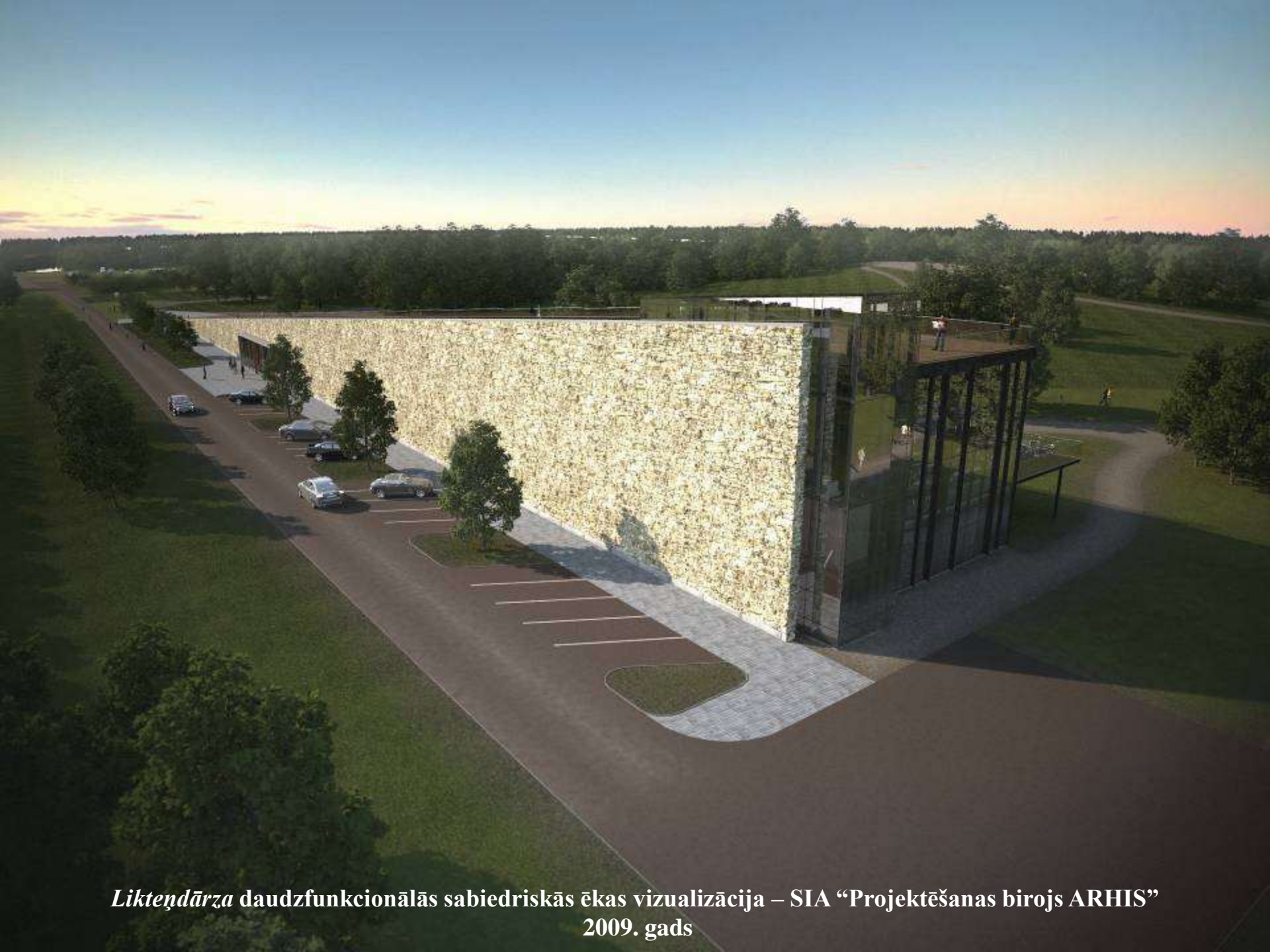
Likteņdārza daudzfunkcionālās sabiedriskās ēkas vizualizācija – SIA “Projektēšanas birojs ARHIS” 2009. gads