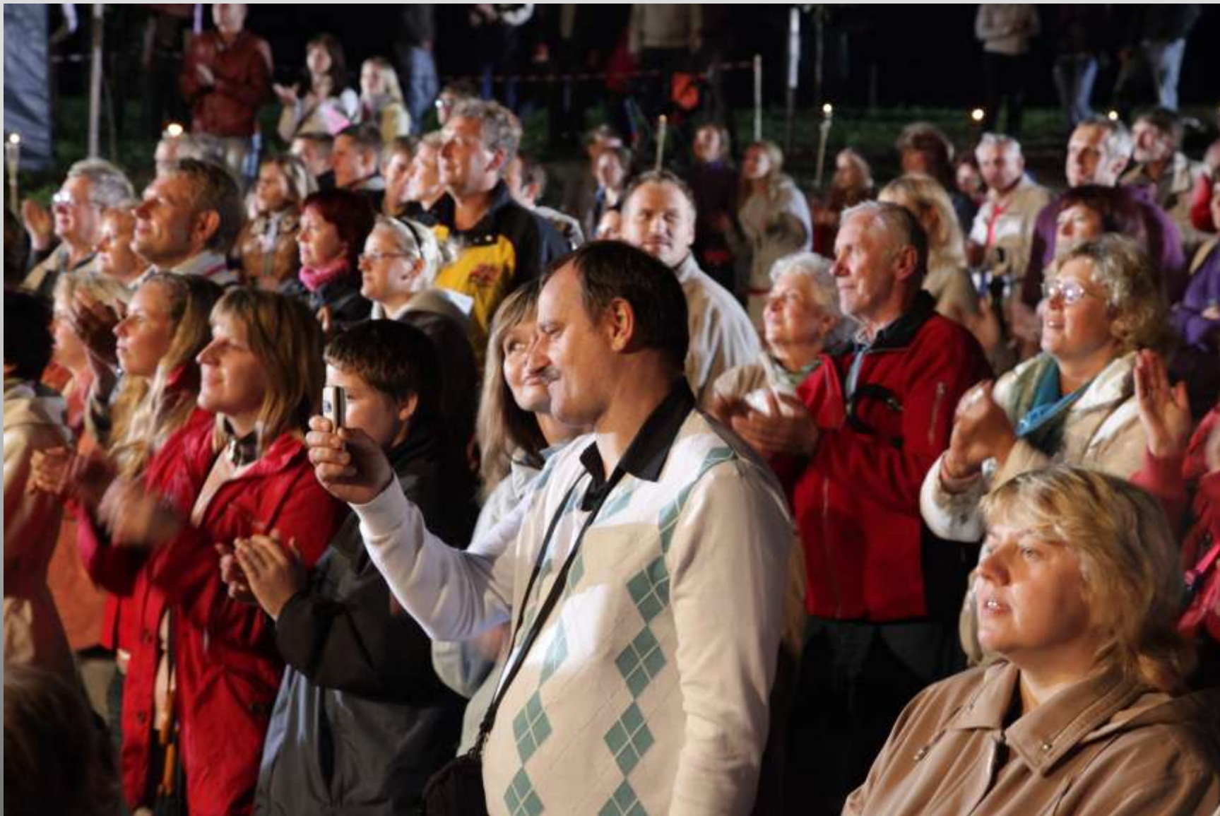
Likteņdārza atbalstītāji ar zvaniem uz ziedošanu tālruni palīdz tapt Likteņdārzam LTV rīkotās akcijas "Top Latvijas Likteņdārzs!" noslēguma koncertā Likteņdārzā 23.08.2009.