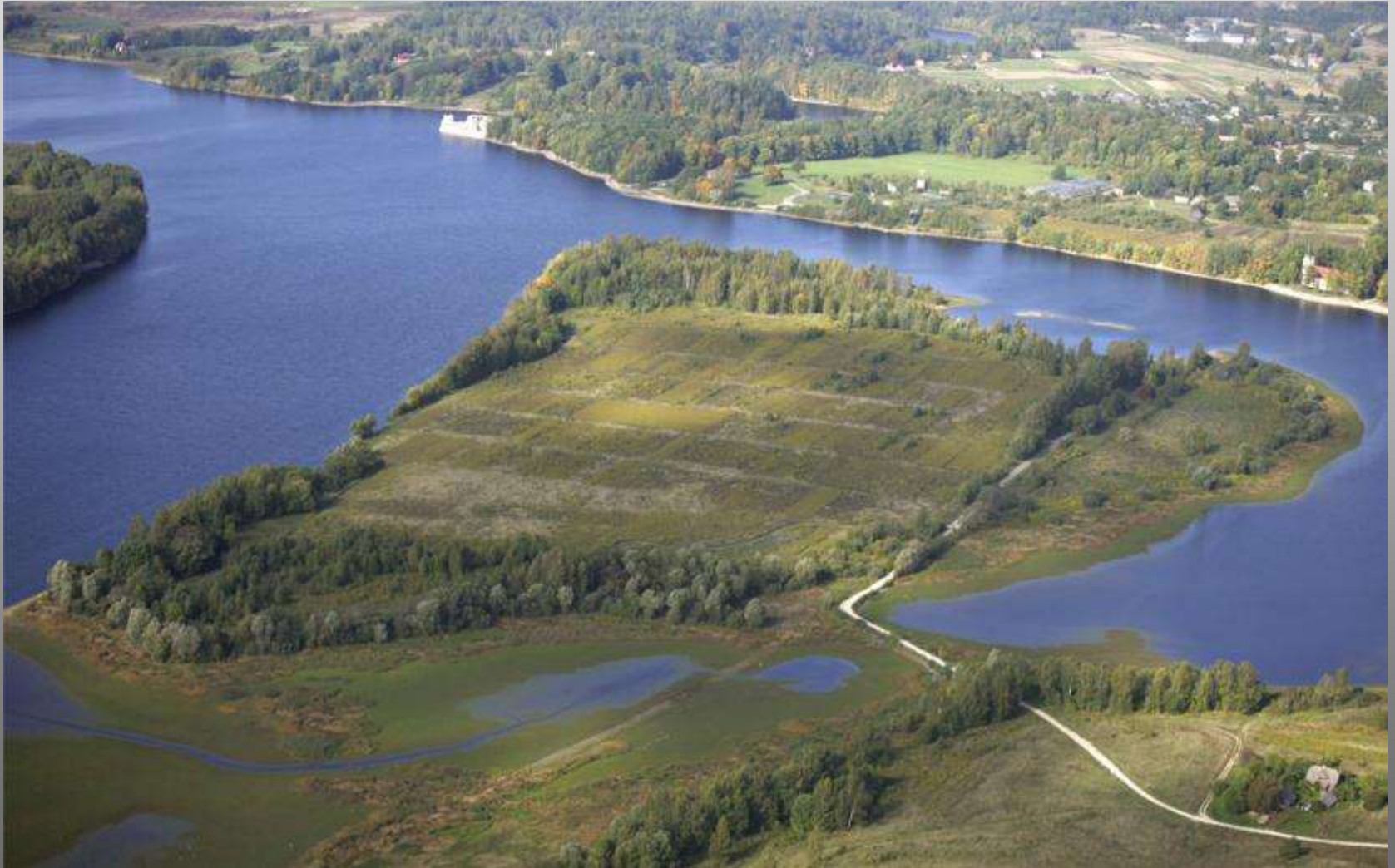
Sala Daugavā, kur tiek īstenots Likteņdārzs / 2005. gads