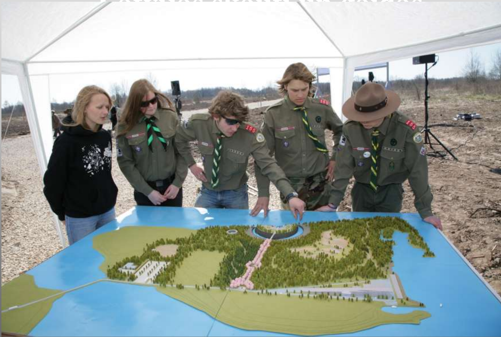
Ābelīšu alejas stādīšanas talkā 23.04.2008.