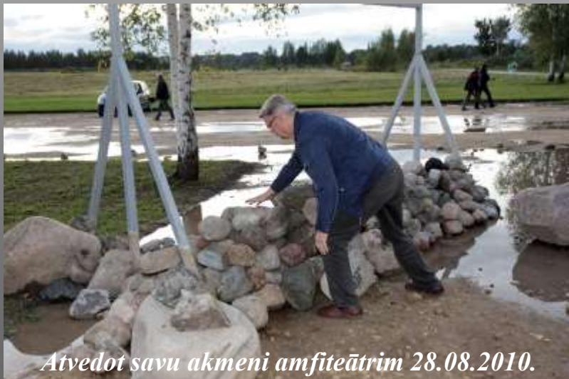
Ātvedot savu akmeni amfiteātrim 28.08.2010.