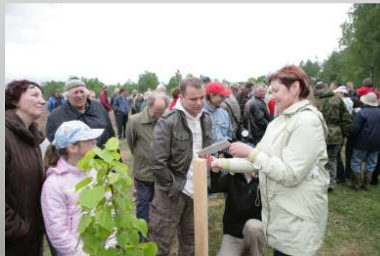
Meža dienu noslēguma pasākumā 23.05.2009.