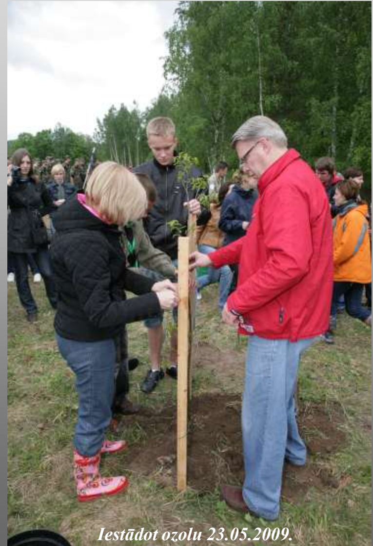
Iestādot ozolu 23.05.2009.