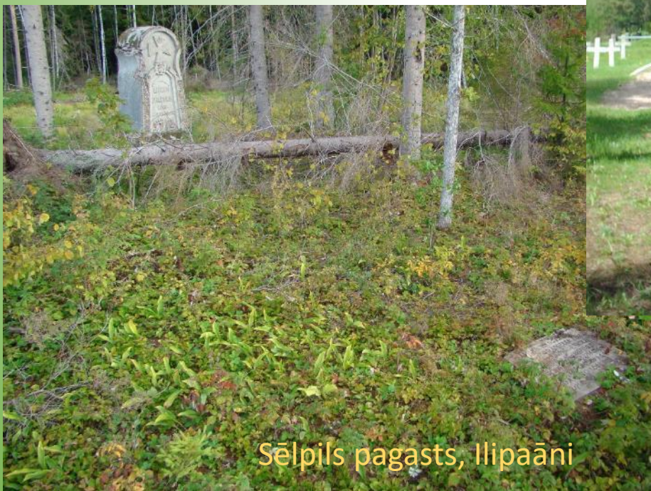
Sēlpils pagasts, Ilipaāni