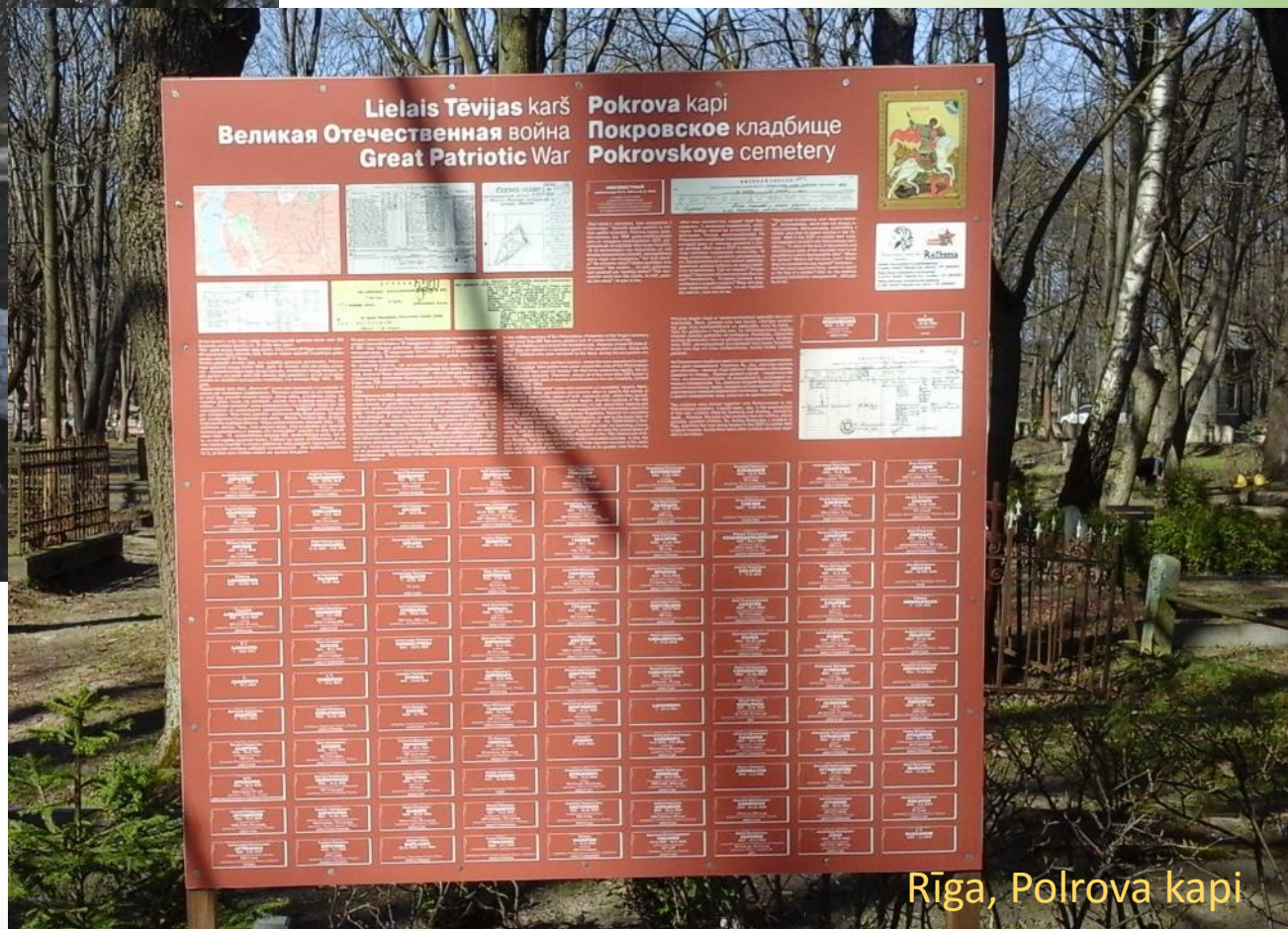
Rīga, Polrova kapi