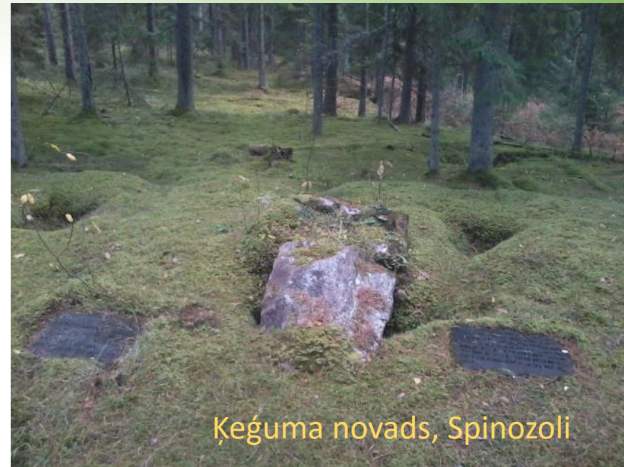
Ķeguma novads, Spinozoli