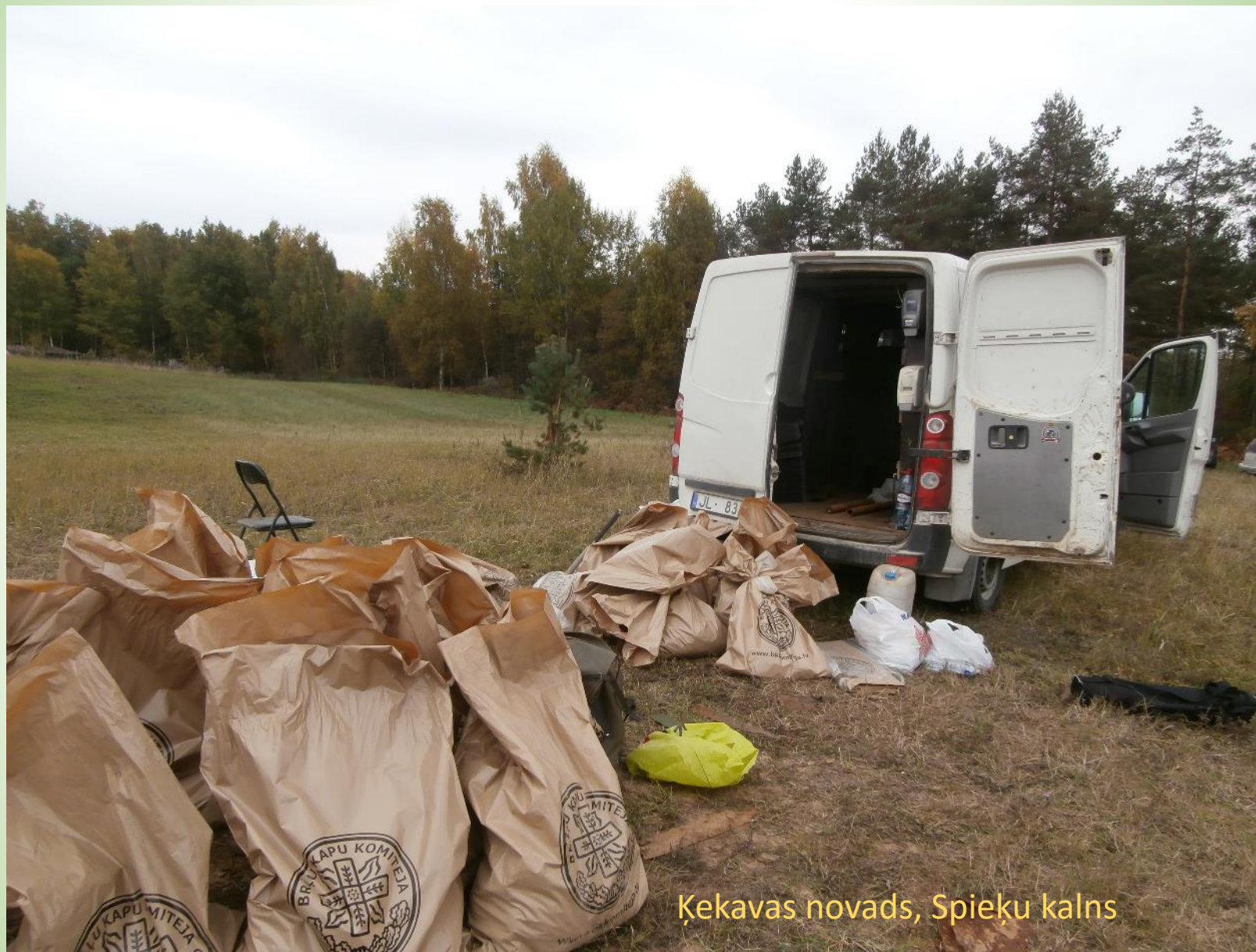
Ķekavas novads, Spieķu kalns