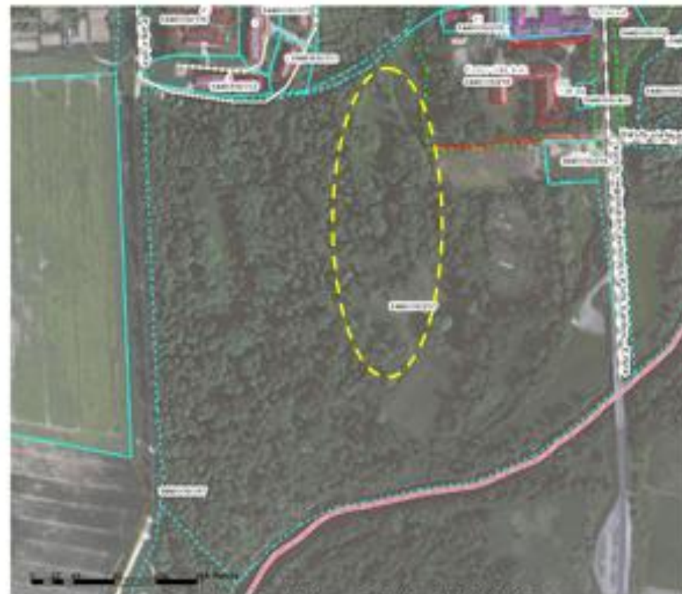
Zemes vienība ar kadastra apzīmējumu 84480060297 Lielcērce paaka, Ezerce pagasts, Saldus novads

KARAVĪRU APBEDĪJUMU VIETAS IZPĒTES DARBU ATĻAUJAI NR. __npl-00__