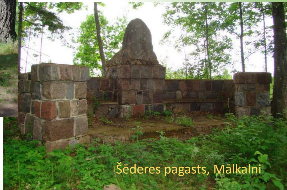
Šēderes pagasts, Mālkalni