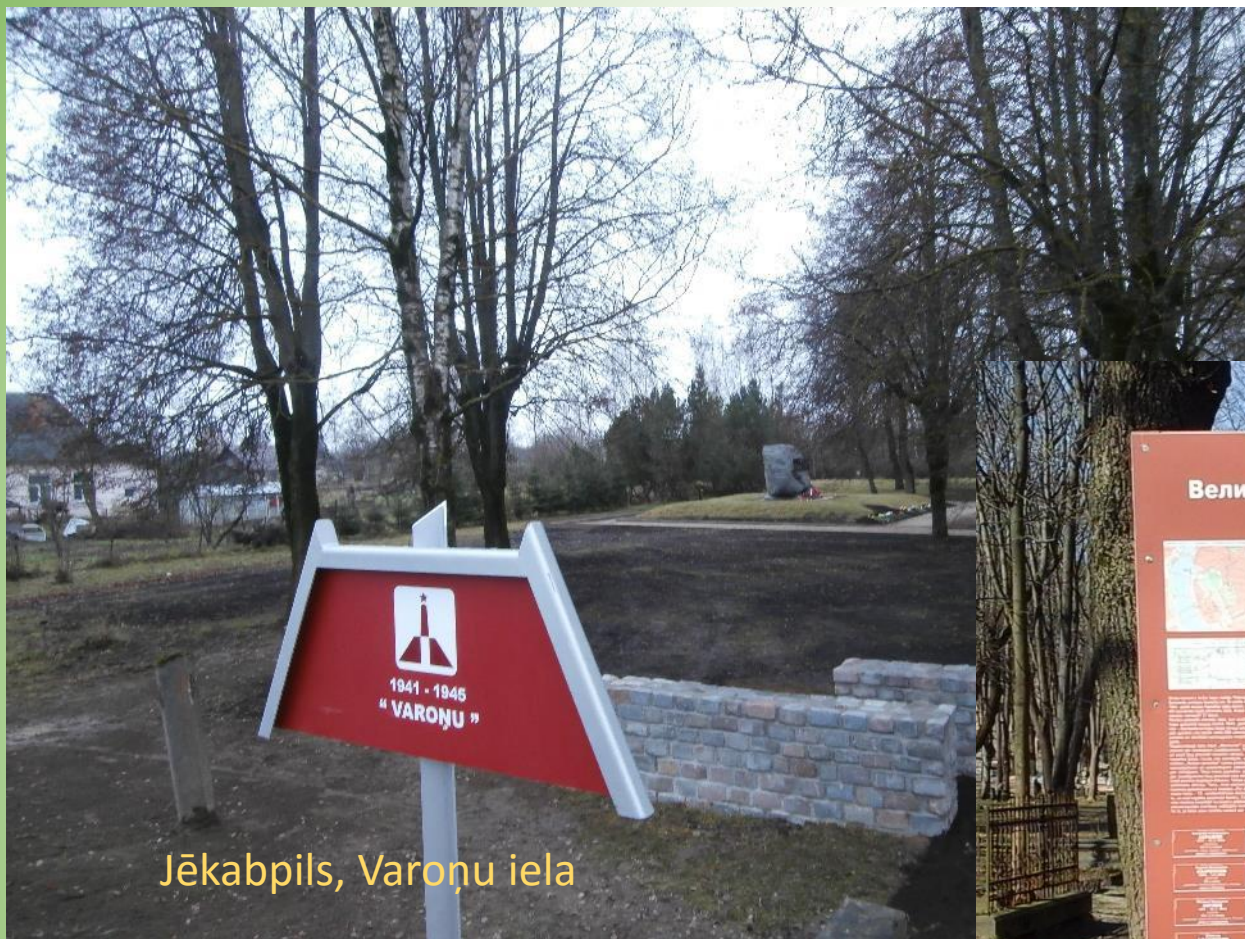
Jēkabpils, Varoņu iela