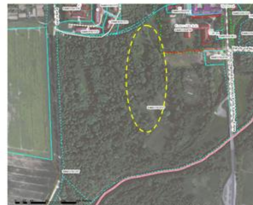
Zemes vienība ar kadastra apzīmējumu 04400600297 Lielceļa gājka, Ezeres pagasts, Balduņi novads

PIELIKUMS BRĀĻU KAPU KOMITEJAS 2016. GADA __dd__ __mm__ IZDOTAJAI KARAVĪRU APBEDĪJUMU VIETAS IZPĒTES DARBU ATĻAUJAI NR. __npk-00__