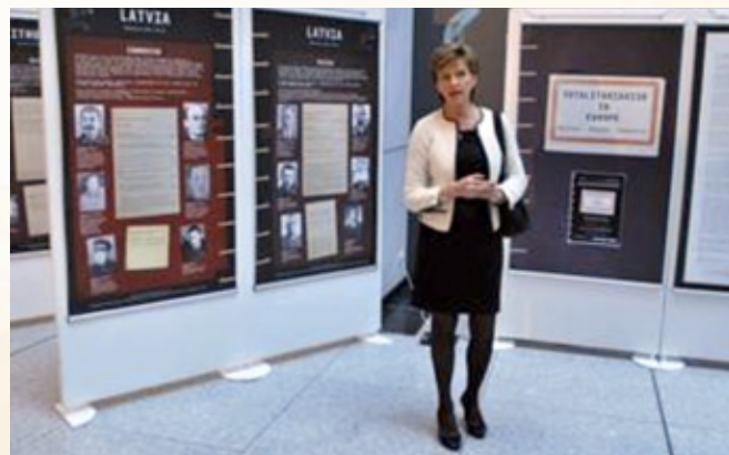
Eiroparlamenta deputāte Inese Vaidere, tiekoties ar Latvijas pašvaldību pārstāvjiem.

Jāatzīst, ka Eiroparlamenta deputāti no Latvijas savos vērtējumos par ieguvumiem, pievienojoties eiropa zonai, nav viennozīmīgi. Tā, piemēram, Inese Vaidere ir piesardzīgi optimistiska, uzsverot, ka zemākās aizdevumu procentu likmes ir Apvienotajai Karalistei, Zviedrijai un Dānijai – valstīm, kuras nav eiropa zonā. Savukārt eiropa zonas valstīm ir augstas likmes. „Tāpēc viennozīmīgais apgalvojums, ka varēsim ietaupīt 900 miljonus, ir nepareizs – tas atkarīgs no mūsu ekonomikas, konkurētspējas un valdības lēmumiem, nevis automātiski no dalības eiropa zonā,” uzsvēra Vaidere. Viņa tāpat norādīja uz nestabilo Grieķijas, Itālijas un Kipras situāciju, kas liek aizdomāties par eiropa zonas nākotnes struktūru, jo patlaban pastāv iestāšanās mehānisms, taču izstāšanās mehānisma nav.