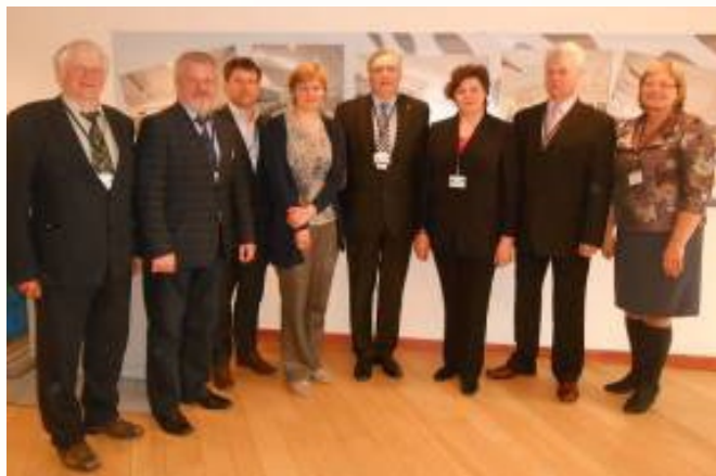
Latvijas delegācija Reģionu komitejā, tiekoties ar EK pārstāvi Lindu Adamaiti

Plaša starp teoriju un praksi ir arī jautājumā par bērnuunamjiem. Liels šķērslis bērnu alternatīvās aprūpes veicināšanai ir tieši sabiedrības domāšana un aizspriedumi. Tāpat risināma problēma ir pienācīgāks valsts atbalsts audžu ģimenēm, kā arī lielākas iespējas iegūt pedagoģiskās zināšanas un speciālistu konsultācijas, lai veicinātu ģimeņu spējas un iespējas pieņemt vairākus vienas ģimenes bērnus, kā arī tādus bērnus, kuriem ir veselības vai attīstības problēmas.