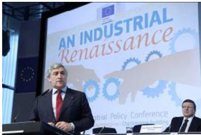
Eiropas Komisijas viceprezidents Antonio Tajāni (pa kreisi).