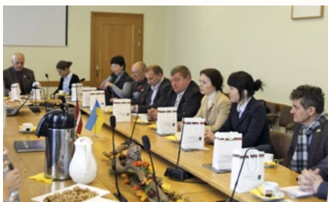
Ukrainas delegācijas viesošanās Madonas novadā

Delegācija, kuras sastāvā bija Ukrainas Reģionālās attīstības ministrijas, Tieslietu ministrijas, prezidenta administrācijas pārstāvji, kā arī parlamenta deputāti un pašvaldību vadītāji, tikās ar Vides aizsardzības un reģionālās attīstības ministrijas (VARAM) un Finanšu ministrijas speciālistiem. Viesi apmeklēja arī LPS un Madonas novadu.