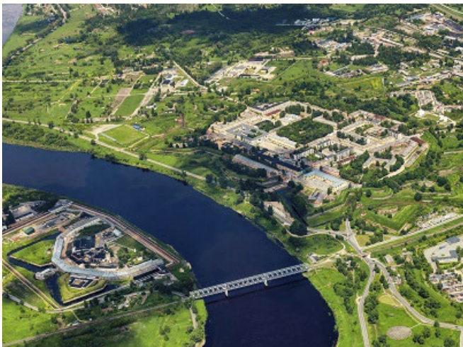
Daugavpils pilsētas domes īstenotais Daugavpils

cietokšņa reģenerācijas projekts ir saņēmis visaugstāko starptautiskās žūrijas novērtējumu Eiropas Padomes (EP) Ģenerālsēkretariāta konkursa “Eiropas Ainavu balva” 5. sesijā. Konkursa mērķis ir apbalvot praktiskās iniciatīvas, kas būtu ņemamas par piemēru ainavu kvalitātes saglabāšanai un uzlabošanai Eiropas ainavu konvencijas dalībvalstu teritorijās.