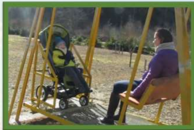
ŠŪPOLES BĒRNIEM RATIŅKRĒSLOS