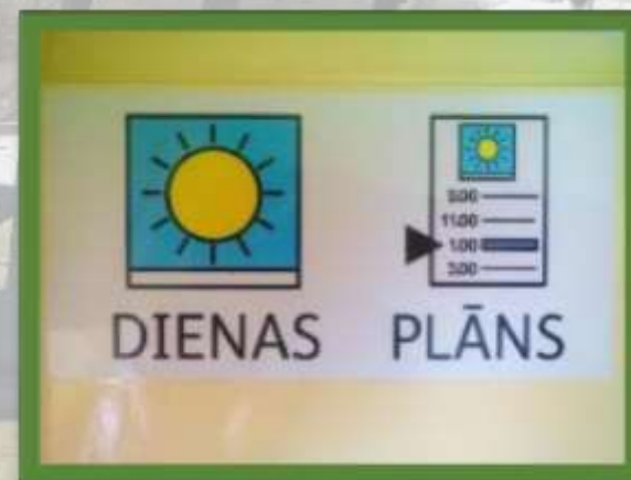
Widgit simbolu valodas sistēma