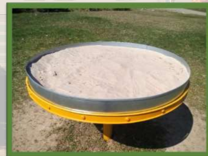
SMILŠU KASTE BĒRNIEM RATIŅKRĒSLOS