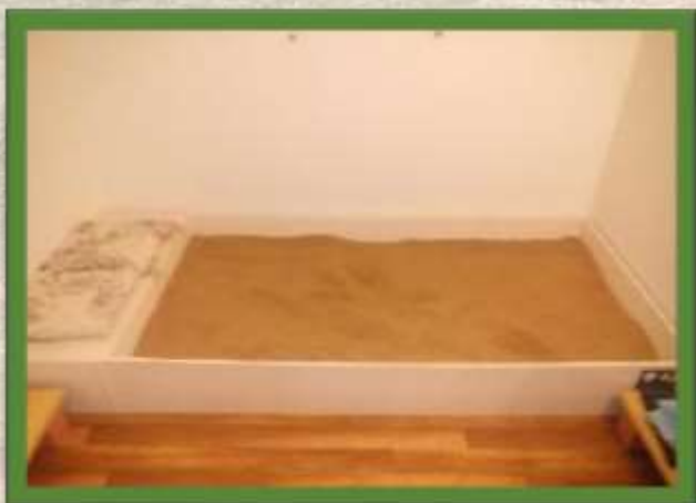
SILTO SMILŠU IEKĀRTA