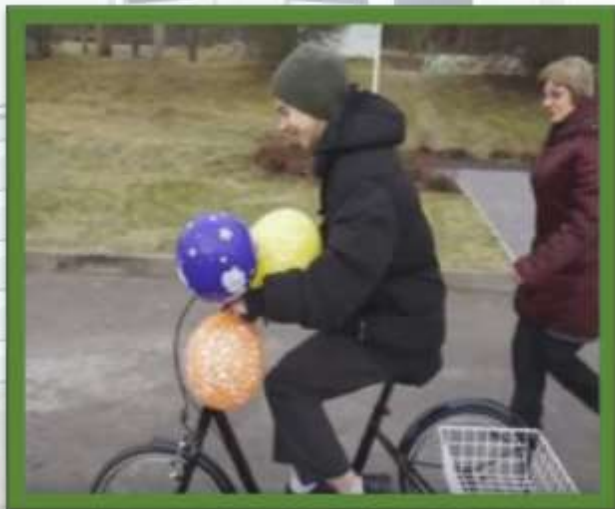
TRĪSRITENĪ BĒRNIEM AR KUSTĪBU TRAUCĒJUMIEM