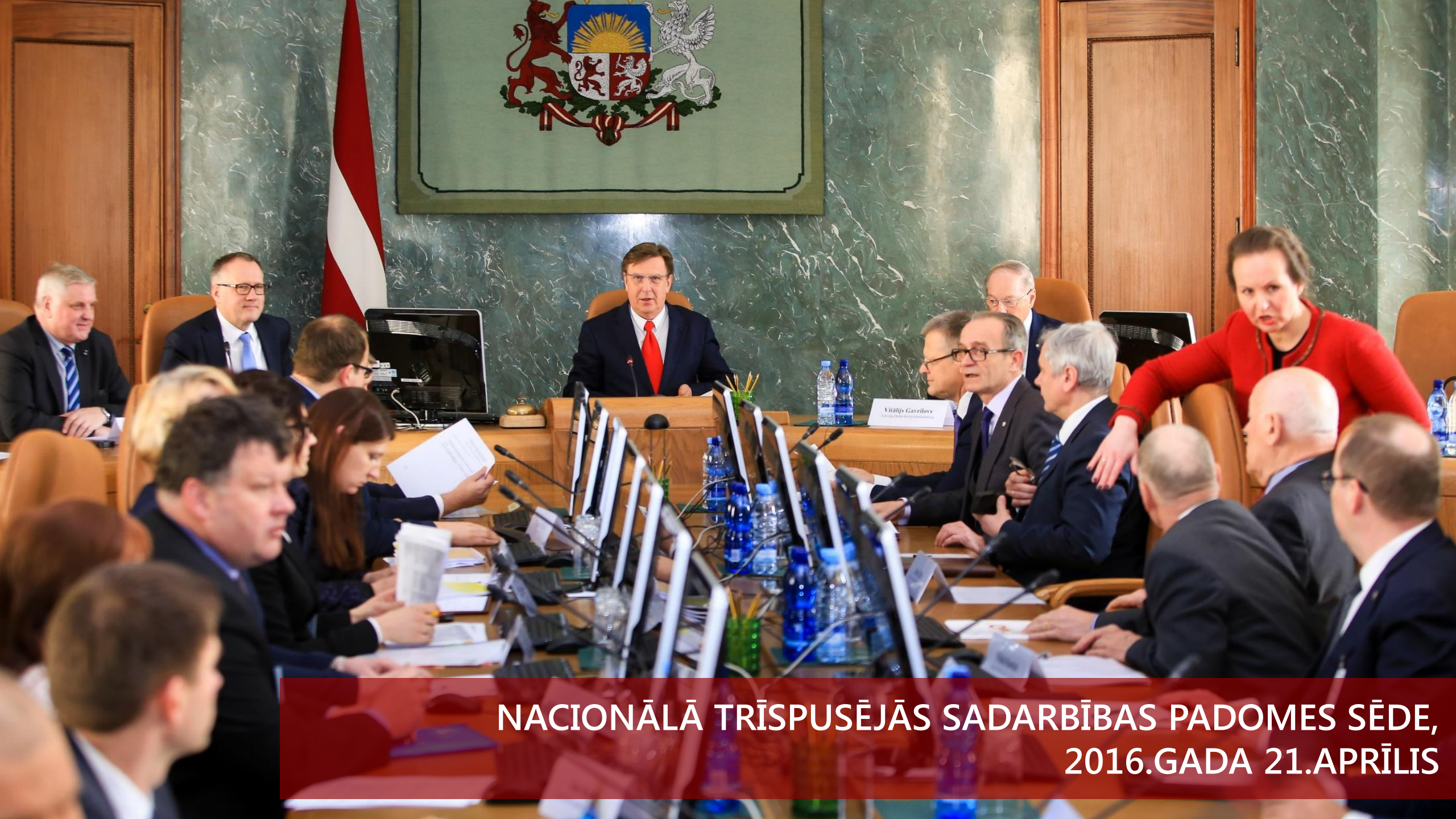
NACIONĀLĀ TRĪSPUSĒJĀS SADARBĪBAS PADOMES SĒDE, 2016.GADA 21.APRĪLIS