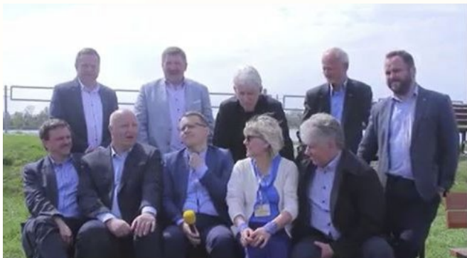
Latvijas Pašvaldību izpilddirektoru asociācijas