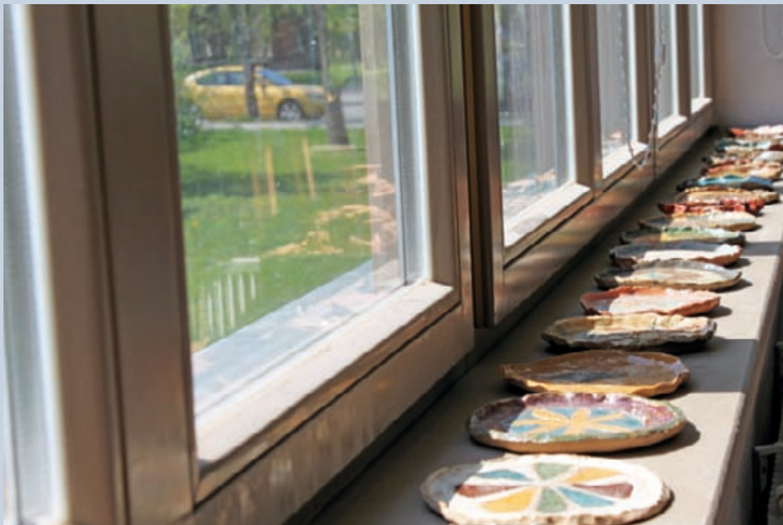
Kuldīgas Mākslas un humanitāro zinību vidusskolas logi