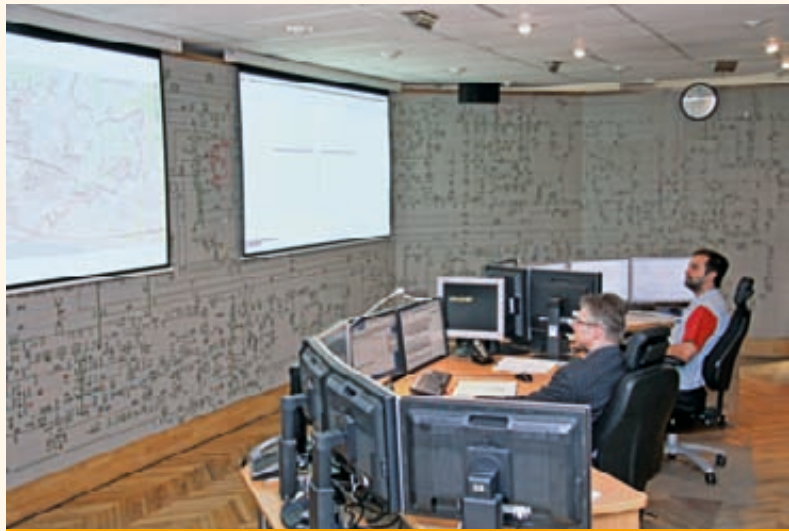
AS "Sadales tīkls" Centrālā reģiona dispečeru centrā.

iespēja ievadīt katras pilsētas vai novada vitāli svarīgos klientu objektus , kam neplāna atslēgumu gadījumos primāri ir jāatjauno elektroapgāde, piemēram, objektus, kas var apdraudēt daudzu cilvēku dzīvību vai nodarīt lielus, neatgriezeniskus ekoloģiskos kaitējumus. Šobrīd notiek šo svarīgo objektu apzināšana un izvērtēšana, ņemot vērā pašvaldību iesniegto individuālo redzējumu par būtisko objektu nodrošināšanu ar elektroapgādi ārkārtas situācijās. AS "Sadales tīkls" ir gandarīts par pašvaldību atsaucību, sniedzot nepieciešamo informāciju.