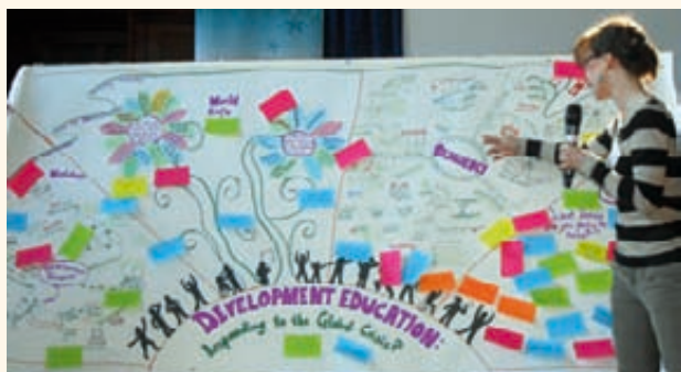
Semināra laikā tapa "Vizuālais ražas lauks", kurā tika ietvertas atziņas par attīstības izglītības rezonansi vietējā sabiedrībā globālās krīzes laikā.

līmenī, stāstot interesentiem par labās prakses pieredzi attīstības sadarbības jomā. Tāpat projektā vietējās pašvaldības tiek mudinātas gūt jaunu pieredzi un zināšanas attīstības sadarbībā, jo īpaši tādās jomās kā informēšanas kampaņas par attīstības sadarbības jautājumiem, jauniešu un brīvprātīgo darbs, kā arī tīklu veidošanas aktivitātes attīstības sadarbības īstenošanai. Kopumā projektā iesaistījušies partneri no septiņām Eiropas Savienības valstīm un asociētie partneri no deviņām valstīm ārpus ES robežām.