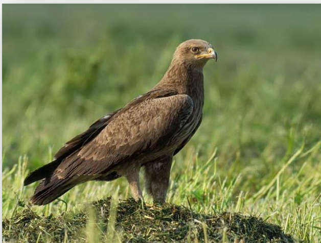
Mazais ērglis.