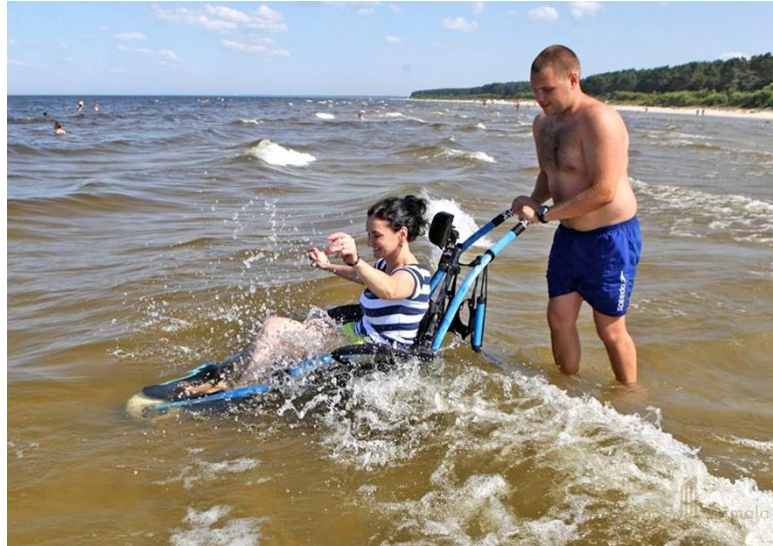
Ratiņkrēsls peldēm jūrā, izmantojot asistenta atbalstu.