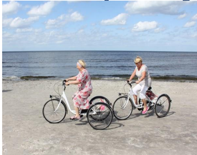
Trīsriteņi personām ar līdzsvara traucējumiem un tandēmrīteņi personām ar redzes traucējumiem.