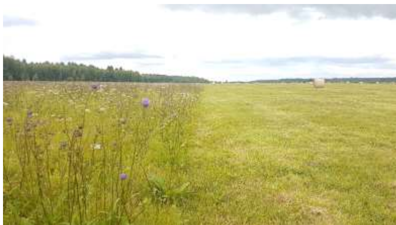
Pakāpeniski pļauta pļava Alsungā