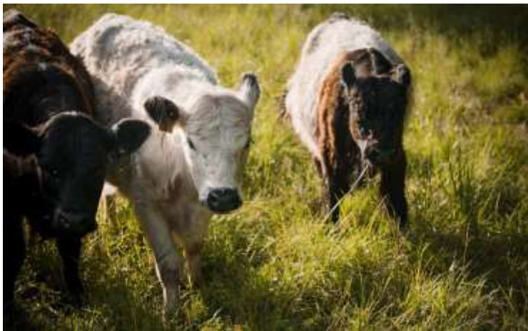
Sigulda, Balonu pļava