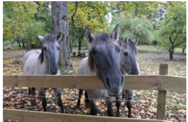
Cēsis, Ruckas parks