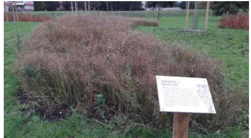
Rīga, Uzvaras parks