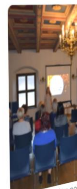
Konkursa „Bauskas no Ziemassvētku rota 2016” pasākums