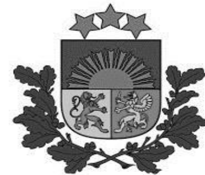
Valsts zemes dienests