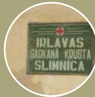
SIA «Irlavas Sarkanā Krusta slimnīca»