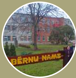
Bērnu un jauniešu centrs «SAPŅI»