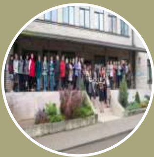
Tukuma novada pašvaldības aģentūra «Tukuma novada sociālais dienests»