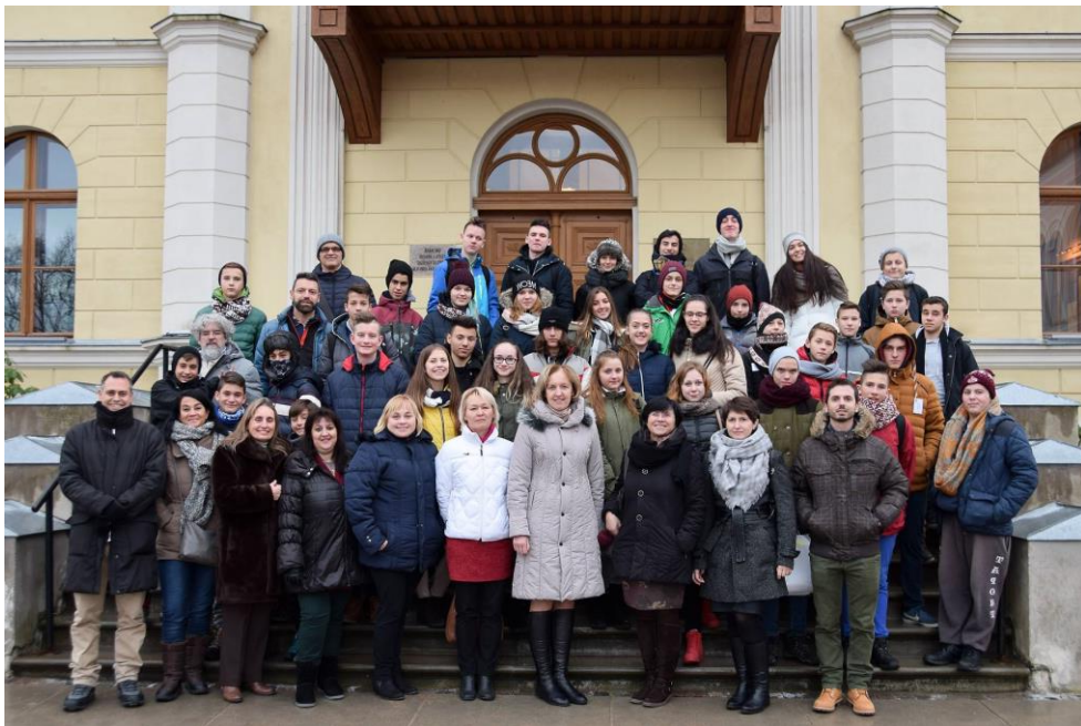
Erasmus+ projekts «Ready Steady Life A Healthy Lifestyle Programme» Vārmes pamatskolā