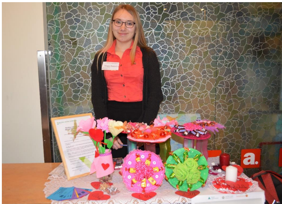
SMU tirdziņi skolās