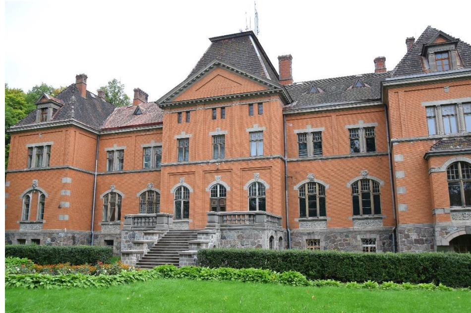
Pelču speciālā internātpamatskola – attīstības centrs