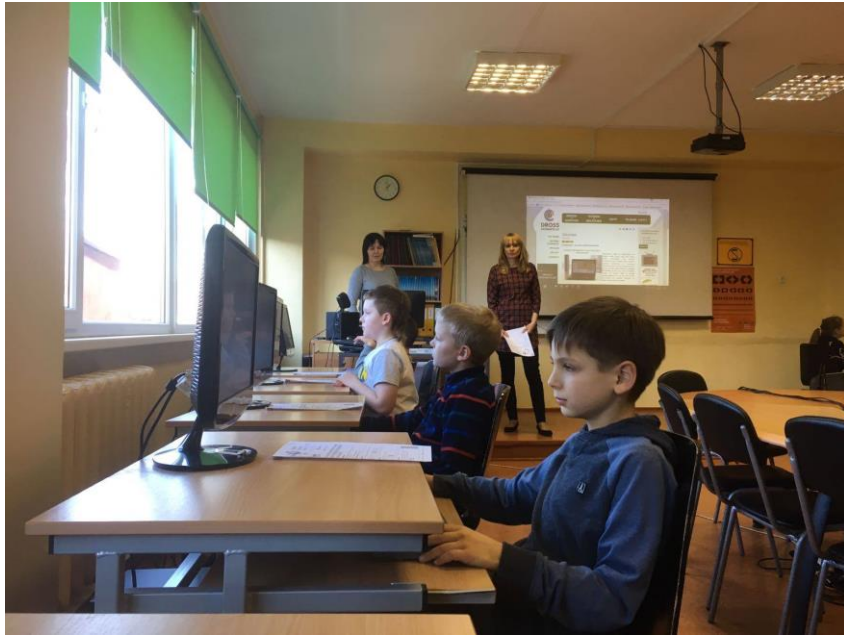
Kuldīgas Centra vidusskola