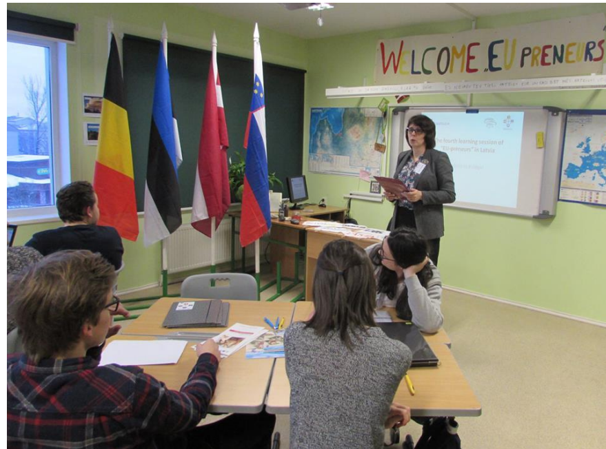
Erasmus+ projekts «EU-Preneurs» V.Plūdoņa Kuldīgas ģimnāzijā