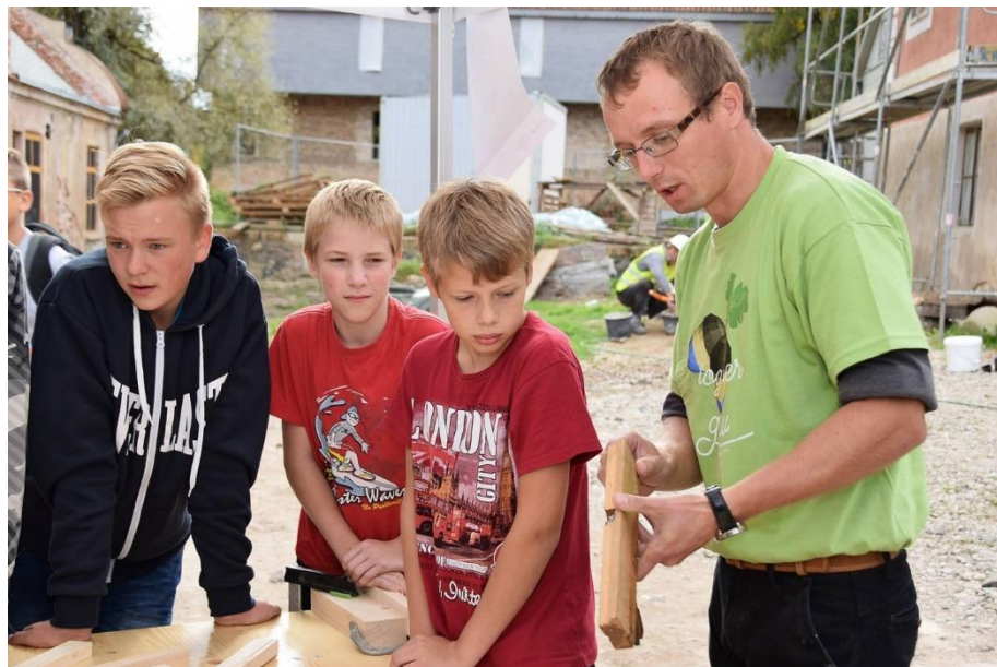
Kuldīgas restaurācijas centra rīkotie pasākumi skolēniem