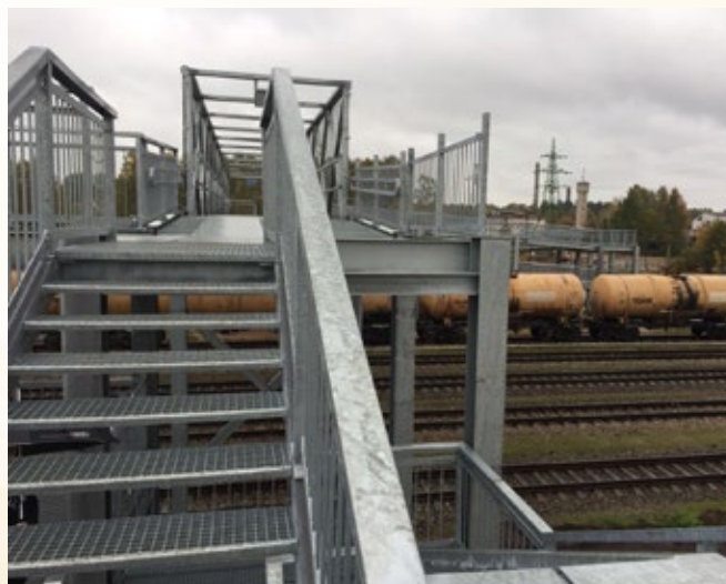
Gājēju pārvada izbūve virs sliežu ceļiem Līvānos

Ar atzinību žūrija izcēlusi vēl vairākus pašvaldību objektus: Putnu parka estrādi Carnikavas novada Kalngalē (nominācijā "Koka būve"), Dubultu Kultūras un izglītības centru, Mūzikas skolu Jūrmalā ("Jaunbūve-sabiedriska ēka") un sienu gleznojumu gājēju tunelī zem dzelzceļa Rīgā, vides objektu "Gaišs" Balvos un paviljonu "Uguns" dabas parkā "Numernes valnis" Kārsavā (visi nominācijā "Publiskā ārtelpa").