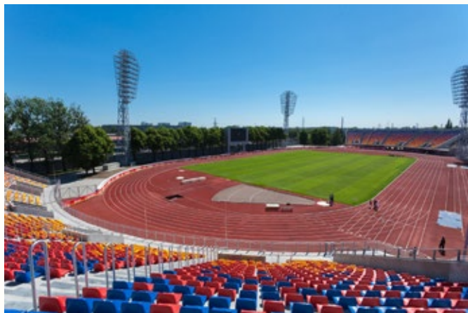
Daugavas stadiona tribīņu pārbūves būvprojekta izstrāde, autorizraudzība un būvniecība Rīgā

Trešo vietu savās nominācijās ieguvuši: A. Kalniņa Cēsu mūzikas vidusskola (nominācijā "Rekonstrukcija"), Alūksnes muižas parka mazās arhitektūras formas Obelisks, Mauzolejs, Putnu paviljons, Ovālā strūklaka, Apaļā strūklaka un Pomonas templis ("Restaurācija"), ēka "Pastnieki" un palīgēka Dundagas novada Kolkas pagastā ("Koka būve"), Valmieras peldbaseins ("Jaunbūve-sabiedriska ēka") un gājēju pārvads virs sliežu ceļiem Līvānos ("Jauna inženierbūve").