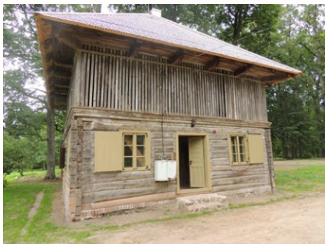
Lielplatones muižas ansambļa ēkas "Vešūzis" restaurācija