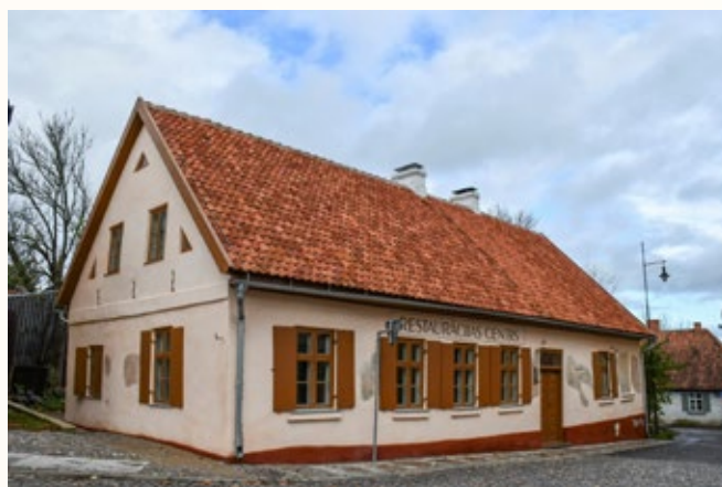
Daudzdzīvokļu dzīvojamās ēkas restaurācija, atjaunošana un pārbūve restaurācijas centra vajadzībām, 1. un 3. kārtā, Baznīcas ielā 30 Kuldīgā