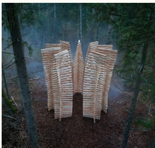
Paviljons "Uguns" dabas parkā "Numernes valnis" Kārsavā