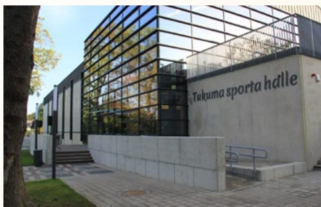
Tukuma 3. pamatskolas sporta zāle un stadions

Otrā vieta savās nominācijās piešķirta šādiem pašvaldību objektiem: Siguldas Kultūras centram (nominācijā "Rekonstrukcija"), daudzdzīvokļu dzīvojamās ēkas pārveidei par restaurācijas centru Kuldīgā ("Restaurācija"), Tukuma 3. pamatskolas sporta zālei un stadionam ("Jaunbūve-sabiedriska ēka"), gājēju un velobraucēju tiltam pāri Riežupei Kuldīgas novadā ("Jauna inženierbūve") un Daugavas stadiona tribīņu projektam Rīgā ("Publiskā ārtelpa").