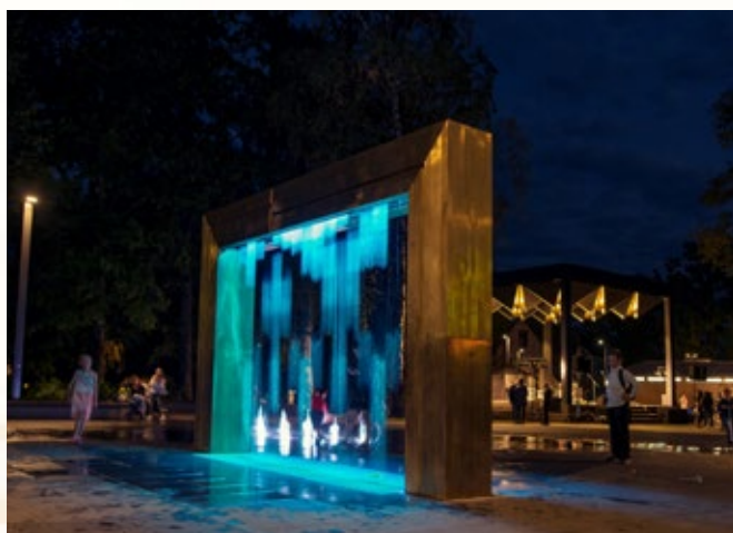
Digitālais strūklaku ansamblis Brīvības ielā 18 Ogrē

Otrā vieta savās nominācijās piešķirta šādiem pašvaldību objektiem: Siguldas Kultūras centram (nominācijā "Rekonstrukcija"), daudzdzīvokļu dzīvojamās ēkas pārveidei par restaurācijas centru Kuldīgā ("Restaurācija"), Tukuma 3. pamatskolas sporta zālei un stadionam ("Jaunbūve-sabiedriska ēka"), gājēju un velobraucēju tiltam pāri Riežupei Kuldīgas novadā ("Jauna inženierbūve") un Daugavas stadiona tribīņu projektam Rīgā ("Publiskā ārtelpa").