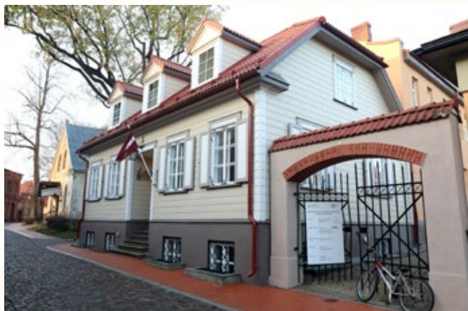
A. Kalniņa Cēsu mūzikas vidusskola

Trešo vietu savās nominācijās ieguvuši: A. Kalniņa Cēsu mūzikas vidusskola (nominācijā "Rekonstrukcija"), Alūksnes muižas parka mazās arhitektūras formas Obelisks, Mauzolejs, Putnu paviljons, Ovālā strūklaka, Apaļā strūklaka un Pomonas templis ("Restaurācija"), ēka "Pastnieki" un palīgēka Dundagas novada Kolkas pagastā ("Koka būve"), Valmieras peldbaseins ("Jaunbūve-sabiedriska ēka") un gājēju pārvads virs sliežu ceļiem Līvānos ("Jauna inženierbūve").