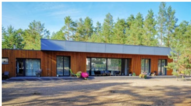
Putnu parka estrādes jaunbūve Carnikavas novada Kalngalē