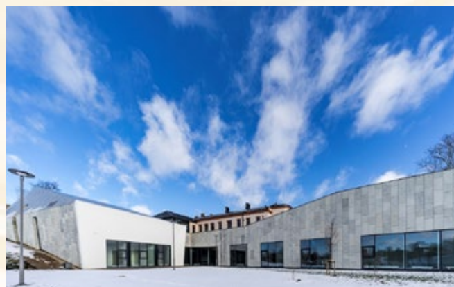
Dobeles mūzikas skolas rekonstrukcija

Apbalvoto objektu vidū ir arī vairāki pašvaldību projekti. Pirmo vietu savā nominācijā ieguvuši šādi objekti: Dobeles Mūzikas skola (nominācijā “Rekonstrukcija”), Jelgavas novada Lielplatonē muižas ansambļa ēka “Vešūzis” (“Restaurācija”), atklātā publiskā slidotava Pasta salā Jelgavā (“Koka būve”) un digitālais strūklaku ansamblis Ogrē (“Publiskā ārtelpa”).