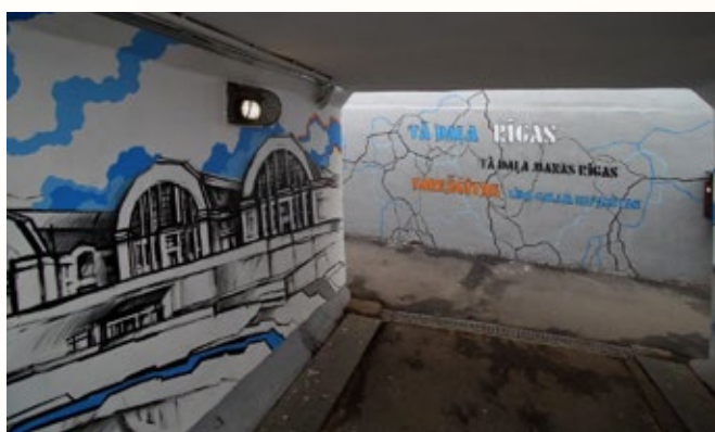
Sienu gleznojuma daļa gājēju tunelī zem dzelzceļa Rīgā, starp Ģertrūdes un Daugavpils ielu