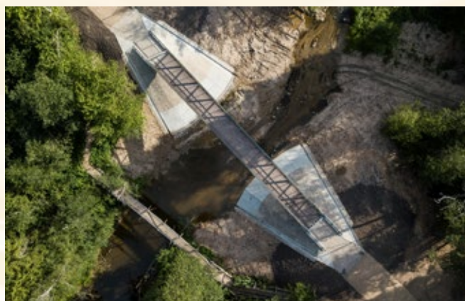
Gājēju un velobraucēju tilts pāri Riežupei autoceļa Mežvalde-Galmīcas 1,24. kilometrā Kuldīgas novadā