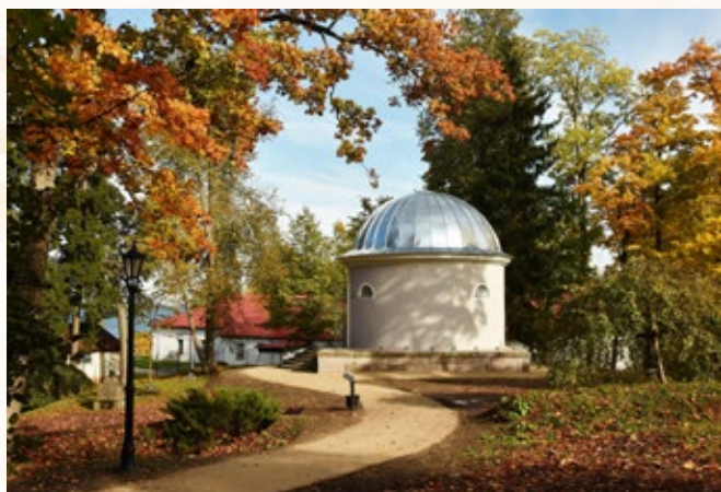
Alūksnes muižas parka mazo arhitektūras formu – Obeliska, Mauzoleja, Putnu paviljona, Ovālās strūklakas un Apaļās strūklakas, Pomonas tempļa – restaurācija