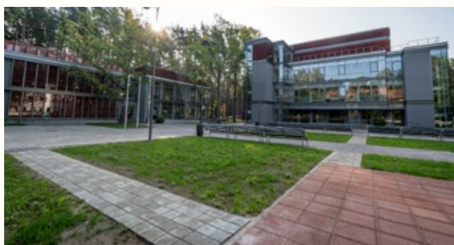
Dubultu Kultūras un izglītības centrs, Mūzikas skola Jūrmalā