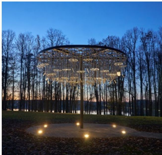
Vides objekts "Gaiss" Balvu estrādes parkā