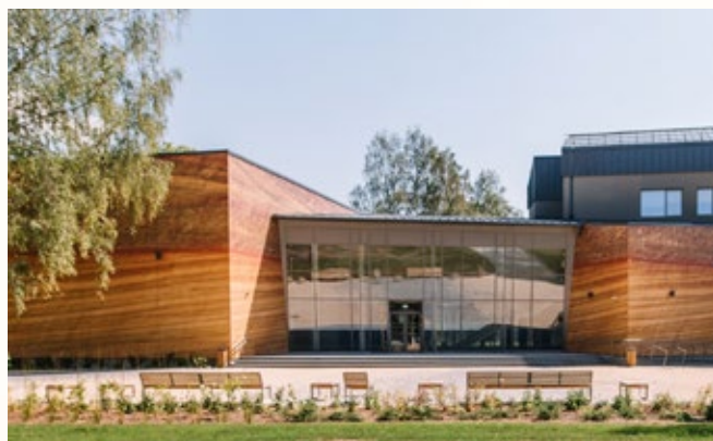
Siguldas Kultūras centra pārbūve