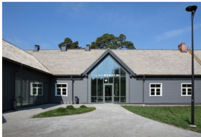
Ēkas "Pastnieki" un palīgēkas pārbūve, teritorijas labiekārtošana Dundagas novada Kolkas pagastā