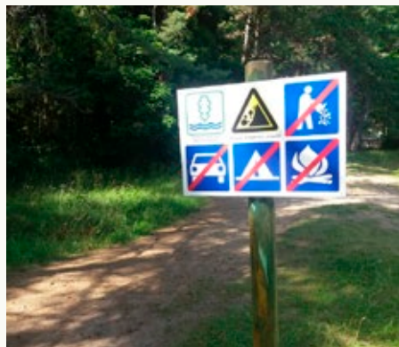
Informācijas zīme Ventspils novada pludmalē.