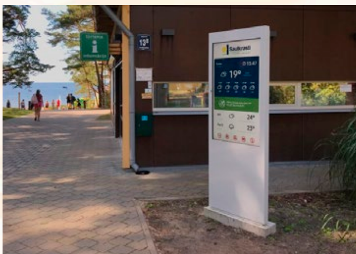
Informatīvais displejs Saulkrastu novada pludmalē.