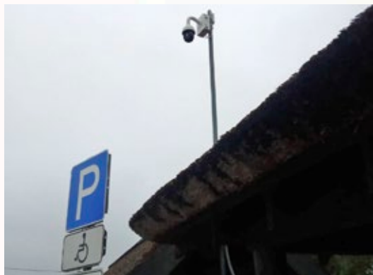
Videonovērošanas kamera Rucavas novada pludmales stāvlaukumā.