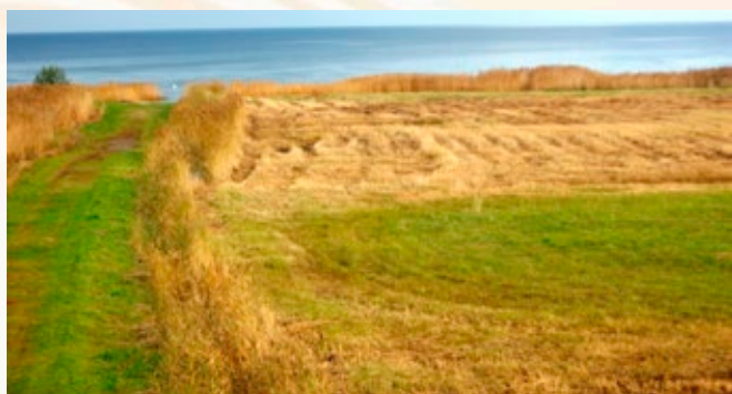
Niedru pļaušana Mērsraga novada pludmalē.