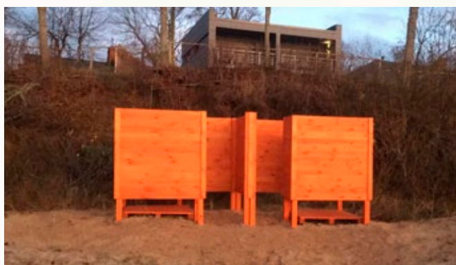
Pārgērbšanās kabīnes Limbažu novada pludmalē.

Projekta darbības būtiski uzlabojušas piekrastes stāvokli. Nākamajos gados ir ļoti būtiski sadalīt pienākumus un atbildību starp pašvaldībām un Dabas aizsardzības pārvaldi (DAP), lai optimāli apsaimniekotu piekrasti gan pašvaldību, gan DAP pārvaldībā esošajās piekrastes teritorijās.