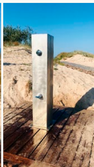
Kāju skalojamā duša Rucavas novada pludmalē.