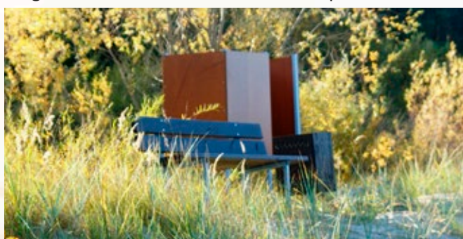
Labiekārtojums Mērsraga novada pludmalē.