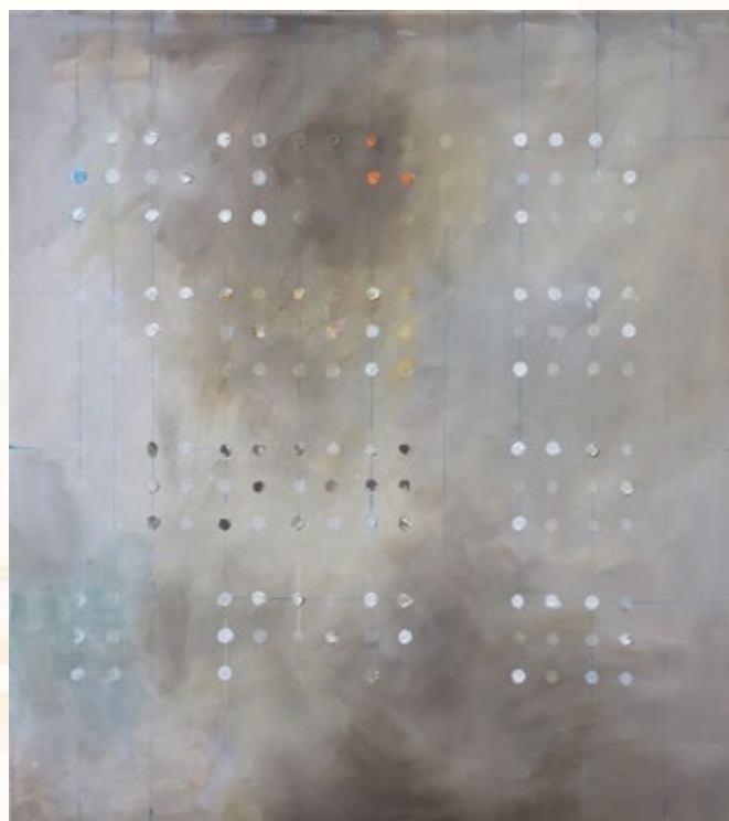
Rūdolfa Daiņa Šmita darbs “Pieskaries man”

13. novembrī Latvijas Nacionālajā bibliotēkā (LNB) atklās mākslas izstādi “Drosme būt”, kuras gaitā sešu nedēļu garumā mākslinieki sadarbosies ar nevalstiskajām organizācijām, lai runātu par invaliditāti un ar to saistītiem jautājumiem.